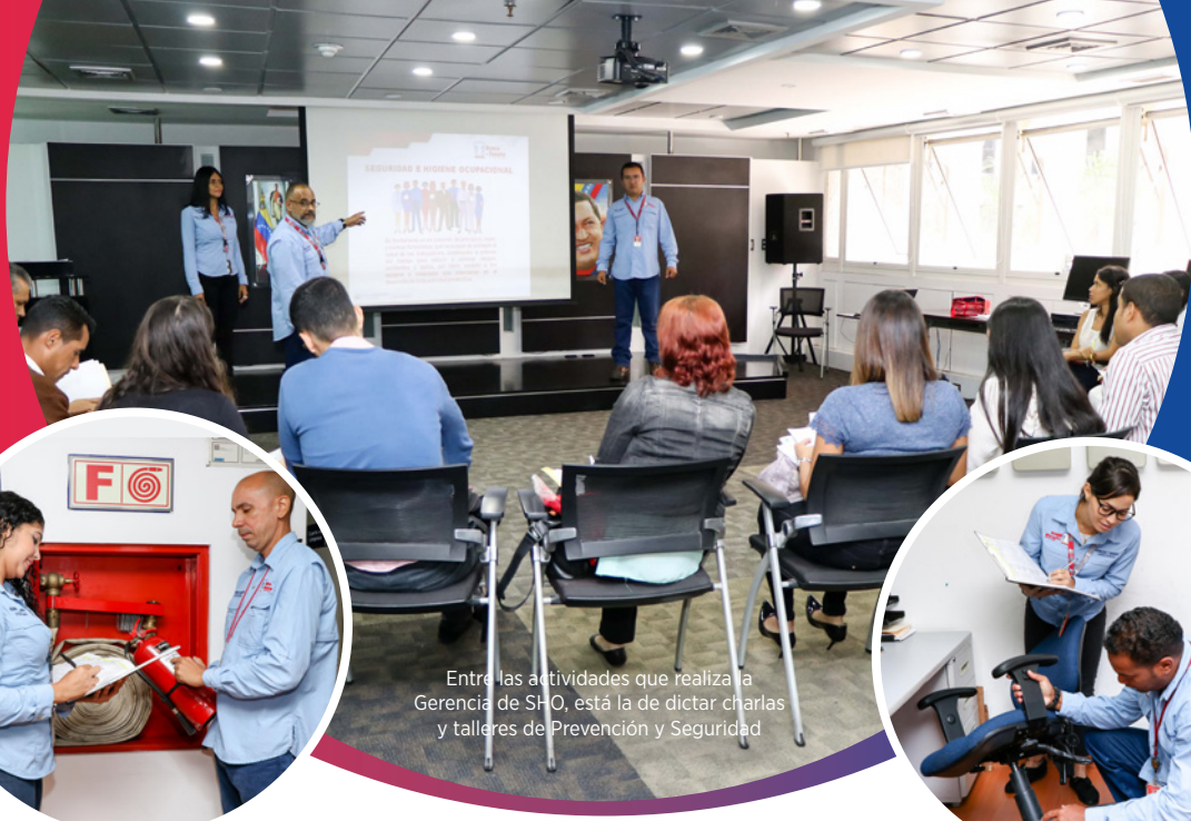
Entre las actividades que realiza la Gerencia de SHO, está la de dictar charlas y talleres de Prevención y Seguridad