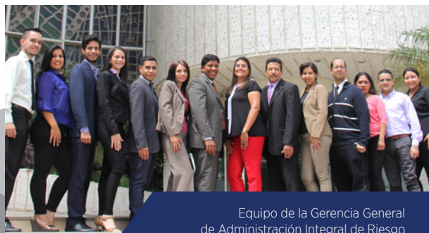
Equipo de la Gerencia General de Administración Integral de Riesgo

Por último, agradeció el apoyo de su equipo de trabajo. “Sin ellos no hubiese sido posible lograr los objetivos, saben que cuentan con mi apoyo para lo que sea, mi relación con ellos no es sólo de tipo laboral, son mis amigos, somos muy unidos como una gran familia, estoy enormemente agradecida con el equipo”.