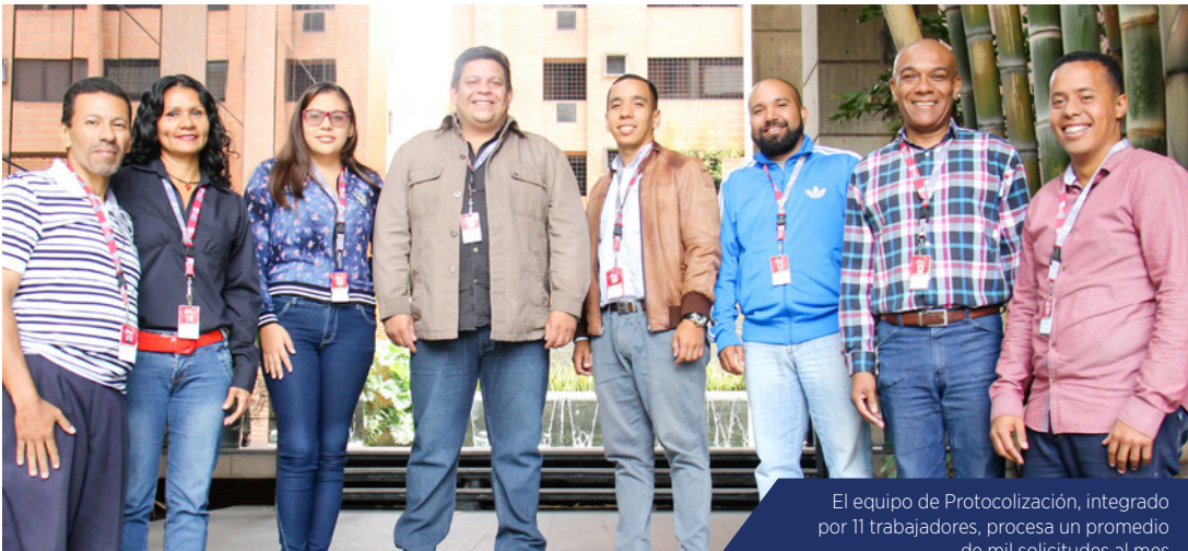
El equipo de Protocolización, integrado por 11 trabajadores, procesa un promedio de mil solicitudes al mes

Al tiempo agregó que la gerencia a su cargo guía “cómo debe ser el proceso de la compra de la póliza, cuáles son los pasos en el registro correspondiente. Por suerte, tenemos buenos enlaces con el Servicio Autónomo de Registros y