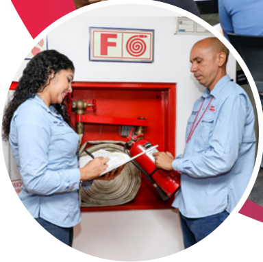
El equipo de SHO, realiza inspecciones para determinar el buen funcionamiento de equipos de protección como extintores