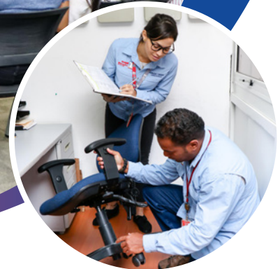
SHO chequea que las sillas se encuentren en buenas condiciones para prevenir cualquier malestar físico en los trabajadores

Asimismo el banco no reporta este tipo de casos con frecuencia. “Prácticamente no se dan estos hechos, lo más recurrente es lo que se denomina Accidente de Trayecto, que ocurre cuando el trabajador se dirige a la institución”, indicó.