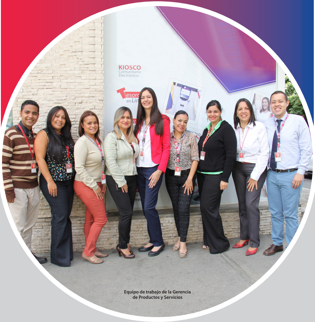
Equipo de trabajo de la Gerencia de Productos y Servicios