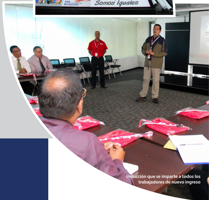
Inducción que se imparte a todos los trabajadores de nuevo ingreso