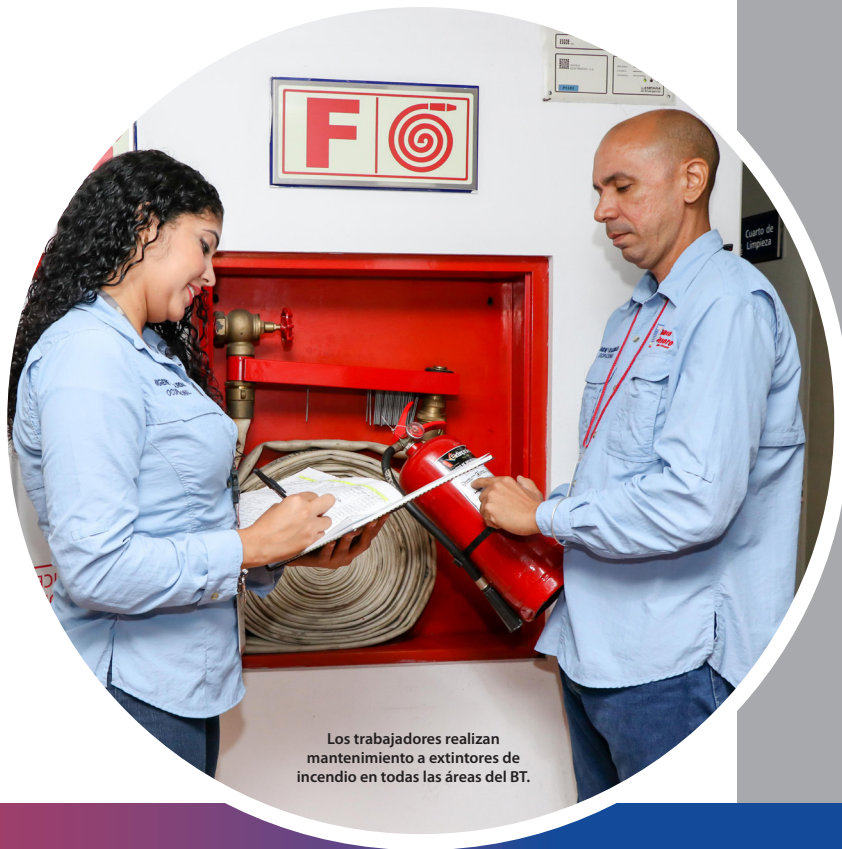
Los trabajadores realizan mantenimiento a extintores de incendio en todas las áreas del BT.

Agregó que, a través de la Gerencia de Línea de Seguridad de la Información se lograron mejoras a la configuración de los enlaces de internet, se migraron servicios críticos como el Juniper que brinda el servicio del Sistema Swift, con las empresas Acredita, Surenet y CestaPago, dejando el servicio VPN activo.