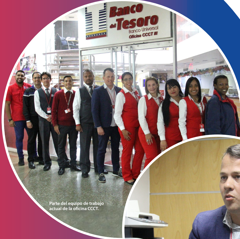
Parte del equipo de trabajo actual de la oficina CCCT.