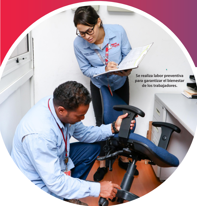
Se realiza labor preventiva para garantizar el bienestar de los trabajadores.