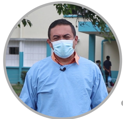
Douglas Jover, viceministro del Ministerio del Poder Popular de Comercio Nacional

“Queremos agradecer a los hombres y mujeres del Banco del Tesoro, en estos 16 años de su cumpleaños, agradecer a la ministra Eneida Laya, también presidenta del banco, por su apoyo constante a nuestra institución y municipio”.